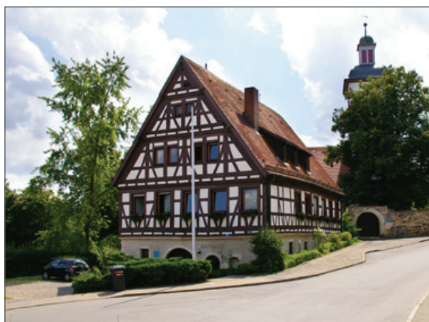
Rathaus und Michaelskirche

Blick für Innovation in Technik und Energie nicht zu vernachlässigen, ist ein Anspruch, dem wir in der Hofgasse einfach gerecht werden mussten.