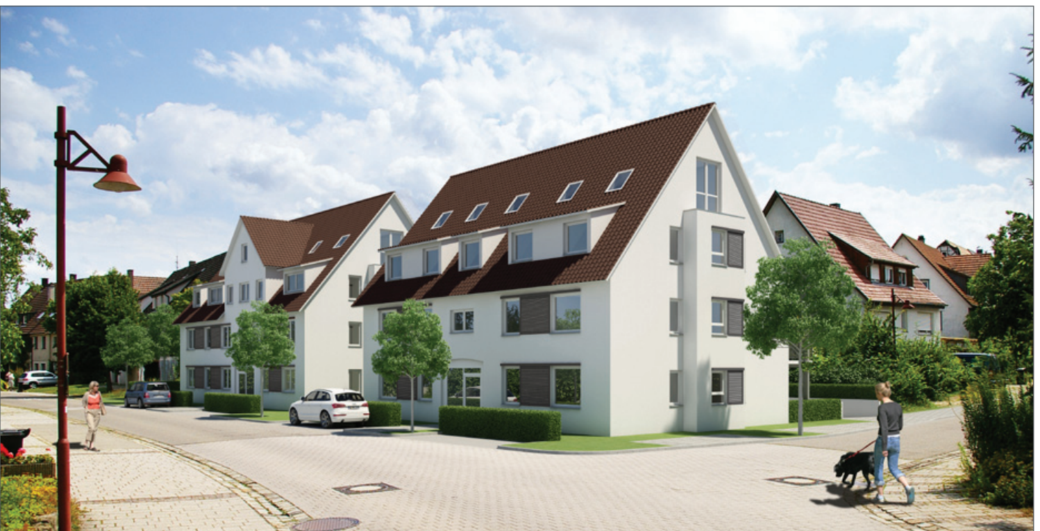
Unsere zwei moderne Mehrfamilienhäuser in der Hofgasse