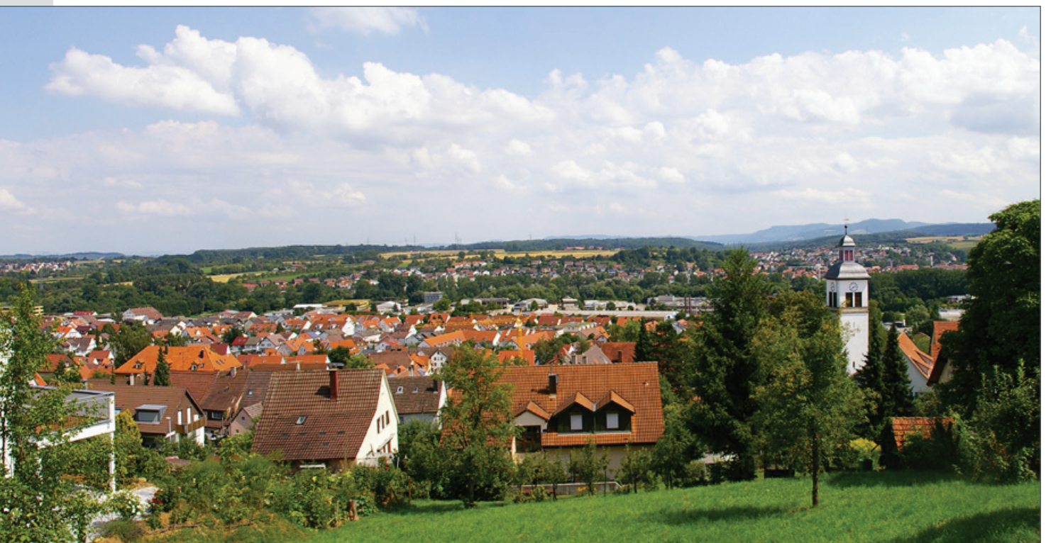
Licht - Luft - Sonne... Blick über Unterensingen