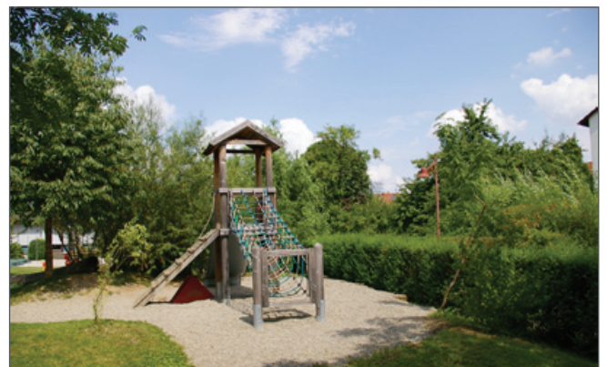
Blick in die Nachbarschaft