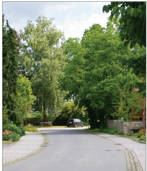
Blick in die Hofgasse